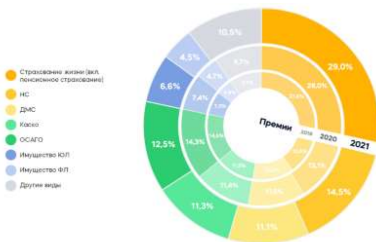
Рис. 2 – Структура рынка по основным видам страхования

Премии по страхованию имущества физлиц увеличились на 14,1% в 2021 году (лучше результатов 2020 и 2019 годов) [7].